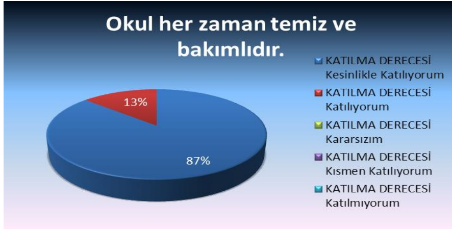
Şekil 6: Okul her zaman temiz ve bakımlıdır.

60 Veli içerisinde Tesadüfi Örneklemeye Yöntemine göre 15 kişi seçilmiştir. Okulumuzda öğrenim gören öğrencilerin velilerine yönelik gerçekleştirilmiş olan anket çalışması sonuçları aşağıdaki gibidir.