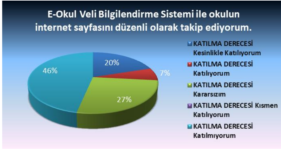
Şekil 7: E-Sistemler takip durumu.