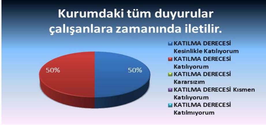
Şekil 4: Kurumdaki tüm duyurular çalışanlara zamanında iletilir.

Okulumuzda görev yapmakta olan toplam 10 öğretmenin tamamına uygulanan anket sonuçları aşağıda yer almaktadır.