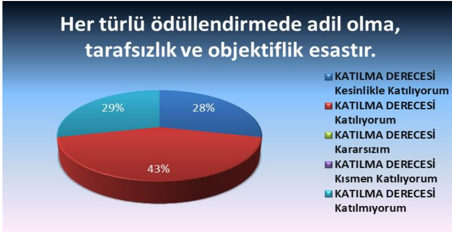
Şekil 5: Her türlü ödüllendirmede adil olma, tarafsızlık ve objektiflik esastır.